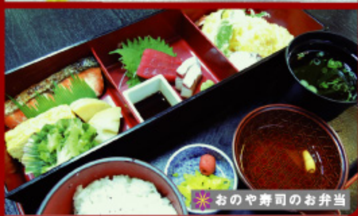
おのや寿司のお弁当