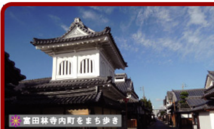
富田林寺内町をまち歩き